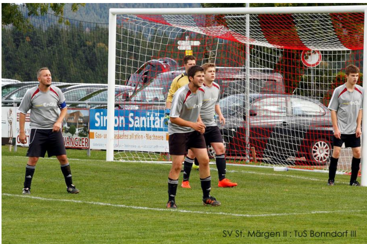
SV St. Margen II : TuS Bonndorf III