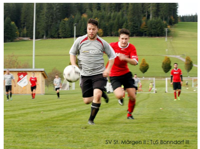
SV St. Margen II : TuS Bonndorf III