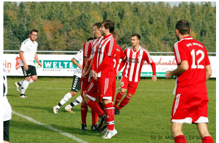
SV St. Margen : SV Saig