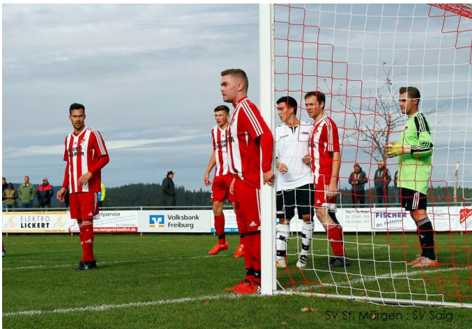
SV St. Margen : SV Saig